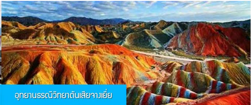
อุทยานธรณีวิทยาต้นเสี้ยวเจีย