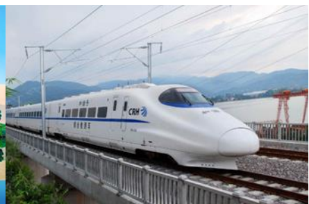
บั้งรถไฟความเร็วสูง