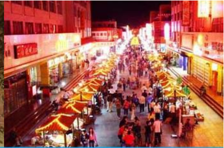
ตลาดกลางคืน ซาโจว

วันที่ 1 ด่านเจียชวี๋กวน – เดินทางสู่เมืองตุนหวง – เที่ยวชมถ้ำมั่วเกา – ชมภาพยนตร์ 3 มิติ-ซาโจวไนท์ มาร์เก็ต