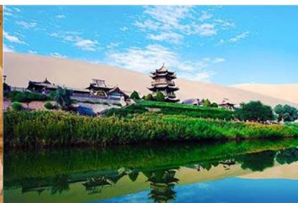
สระน้ำวพระจันทร์