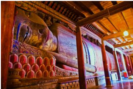
วัดพระใหญ่

พักที่ SI LU QIAN XI HOTEL โรงแรมระดับ 4 ดาวห้องดีน หรือเทียบเท่าในเมืองจางเยี่ยน