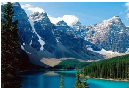
ภูเขาเทียนชาน

พักที่ MERCURE HOTEL โรงแรมระดับ 4 ดาวท้องถิ่นหรือเทียบเท่าในเมืองอูร์มุฉี