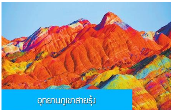
อุทยานภูเขาสายรุ้ง