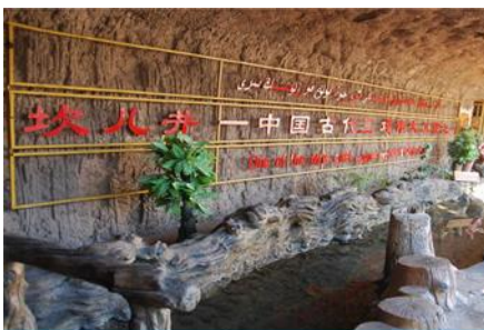
ระบบชลประทานอู่หลู่ฟาน

พักที่ HAMPTON BY HILTON HOTEL โรงแรมระดับ 4 ดาวหรือเทียบเท่าในเมืองอู่หลู่ฟาน