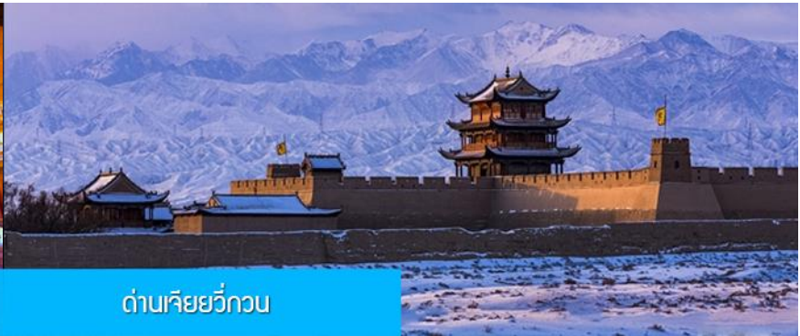
ด่านเจียยวี่กวน

วันที่สาม เมืองจางเยี่ยน – วัดพระใหญ่เมืองจางเยี่ยน –เดินทางสู่เมืองเจียยวี่กวน-ด่านเจียยวี่กวน