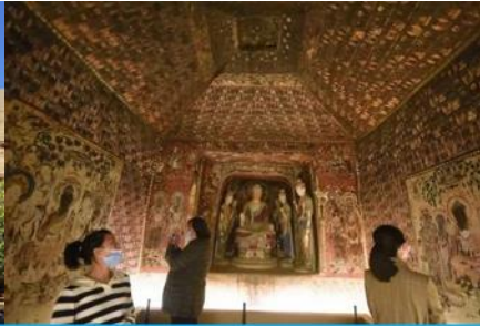
ชมภาพยนตร์ 3 มิติ