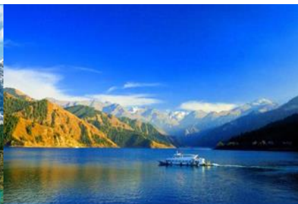
ล่องเรือทะเลสาบเทียนฉือ