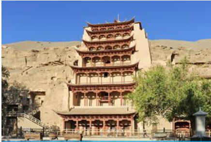
ถ้ำหินมั่วเกา

พักที่ REZEN HOTEL ระดับ 4 ดาวท้องถิ่นหรือเทียบเท่าในเมือง เจียชวี๋กวน